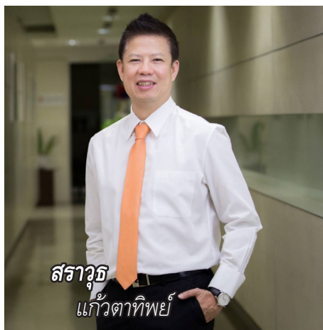
สรวิชญ์ แก้วตาทิพย์

น ายสรวิชญ์ แก้วตาทิพย์ อธิบดีกรมเชื้อเพลิงธรรมชาติ เปิดเผยว่า ขณะนี้กรมเชื้อเพลิงฯ อยู่ระหว่างเตรียมหารือร่วมกัน 3 ฝ่าย ระหว่างบริษัทเซฟรอนประเทศไทยสำรวจและผลิต จำกัด ในฐานะผู้ดำเนินการ (Operator) แหล่งเอราวัณในปัจจุบัน บริษัท ปตท.สผ. เอนเนอร์ยี ดีเวลลอปเม้นท์ จำกัด ซึ่งเป็นบริษัทย่อยของบริษัท ปตท.สำรวจและผลิตปิโตรเลียม จำกัด (มหาชน) หรือ PTTEP ในฐานะผู้ดำเนินการ (Operator) รายใหม่ และกรมเชื้อเพลิงฯ ในฐานะหน่วยงานกลาง เพื่อให้บรรลุข้อตกลงเข้าพื้นที่ระยะที่ 2 ระหว่าง เซฟรอนฯ และ ปตท.สผ. ซึ่งจะเปิดให้ ปตท.สผ. เข้าพื้นที่แหล่งเอราวัณ